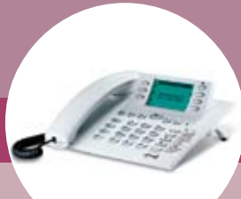
CS410, CS410-U, IP-S400