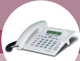
CS290, CS290-U, IP-290, IP-S290