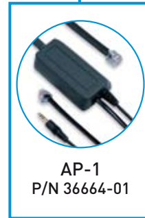
AP-1 P/N 36664-01