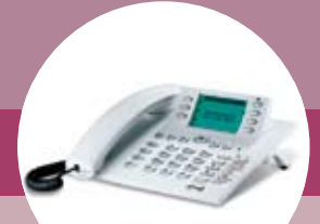
CS410, CS410-U, IP-S400 (DHSG)

Anschluss an Handapparat. Rufannahme durch Abnahme des Handhörers.