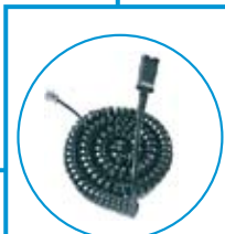
Anschlusskabel U10P-S P/N 38099-01

ⓘ Beim CS410, CS410-U, CS290-U und IP-S400 muß der im Lieferumfang vom Endgerät enthaltene Adapter verwendet werden.