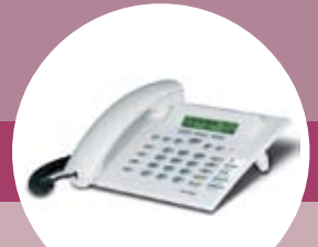
CS290, CS290-U, IP-290, IP-S290